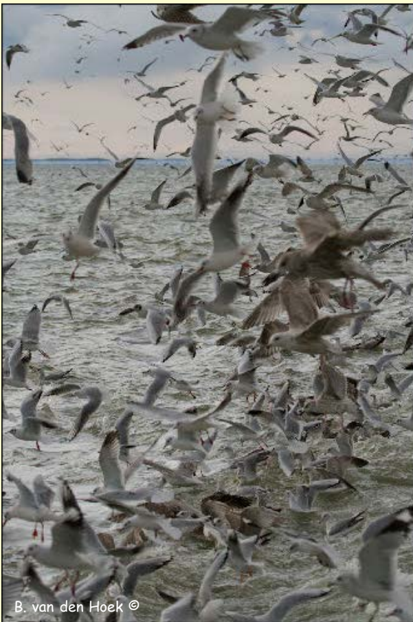
B. van den Hoek ©