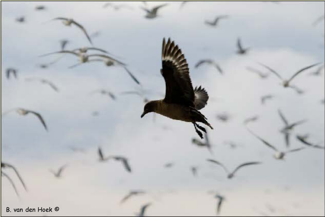
B. van den Hoek ©