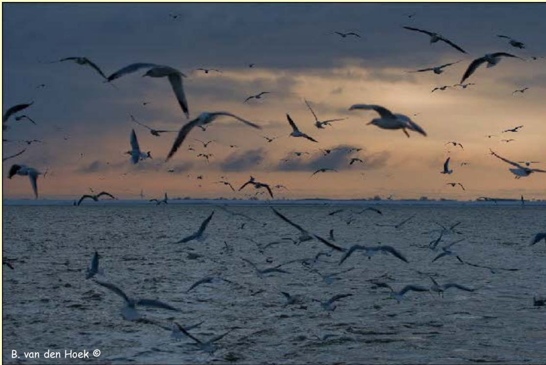
B. van den Hoek ©