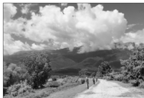
Vogelen vanaf de dijk rond het meer