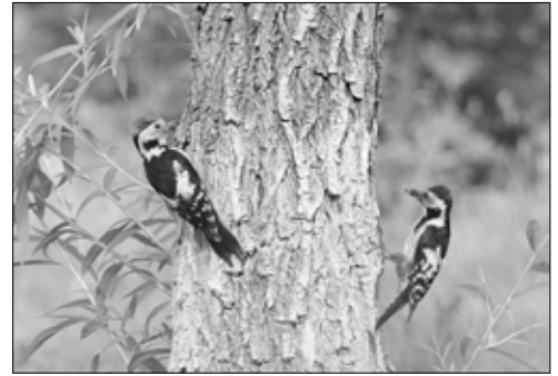
Ouderpaar Middelste bonte specht

Elke namiddag ontwikkelt zich een onweer in de bergen rond het meer, maar behalve dreigende donkere Willink-luchten hadden de begeleidende hoosbuien onze activiteiten niet gehinderd. Nu zijn we net op tijd terug bij de ranch om vanonder de overkapping te genieten van een zeldzaam zware stortbui die een uur aan-