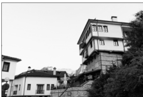
Ons hooggelegen verblijf in Melnik, foto Roel Pannekoek

Melnik is gelegen in de zuidelijke uitlopers van het Piringebergte. Het is een dorp met authentieke hoge huizen in typische Bulgaarse bouwstijl en valt onder beschermd dorpsgezicht. Het ligt ingeklemd in een smalle kloof met aan beide zijden steile hellingen van gele zandsteen tot zo'n 100 meter hoog. Door het lintdorp loopt een berggrivertje dat de meeste tijd van het jaar droog staat. Vanwege het karakter van het dorp, de