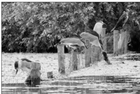
Vissende Kwakken

Na een snelle aanvaart bereiken we het broedgebied van Aalscholvers, reigers, pelikanen, sterns en andere soorten die aan water en moerasbossen zijn gebonden. We worden omringd door duizenden vogels in een kakofonie van kakelende Aalscholvers die massaal de nesten in de hoog opschietende en wit bescheten wilgen bevolken. Op de zandbanken staan honderden pelikanen mannetje aan mannetje,