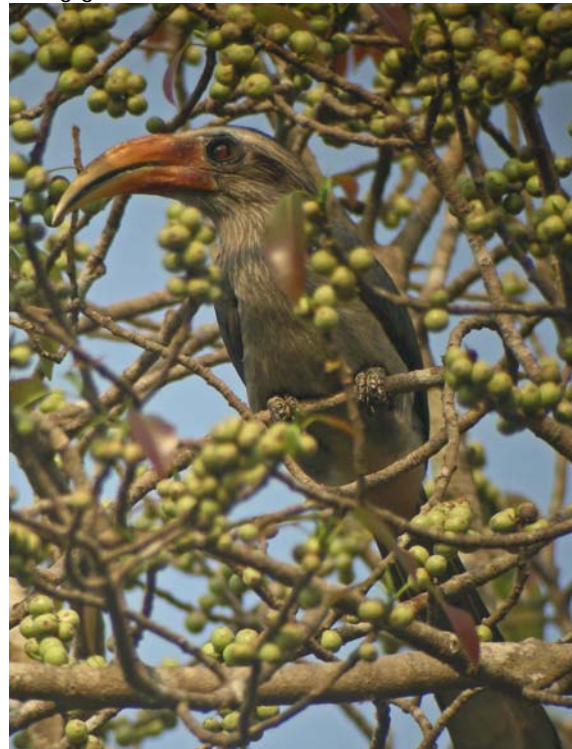
Malabar Grey Hornbill

Als je het verblijf boekt (via www.backwoodsbirding.com ) wordt je ook nog eens van je hotel opgehaald en weer terug gebracht.