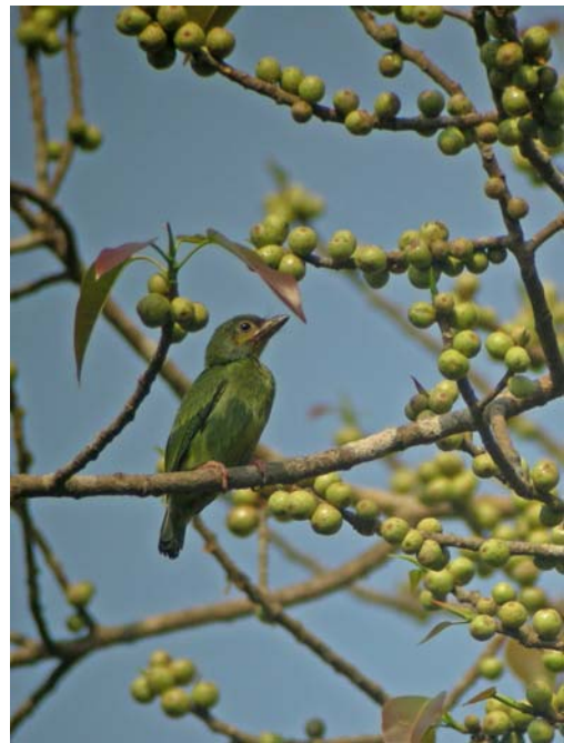
Malabar Barbet (juvenile)